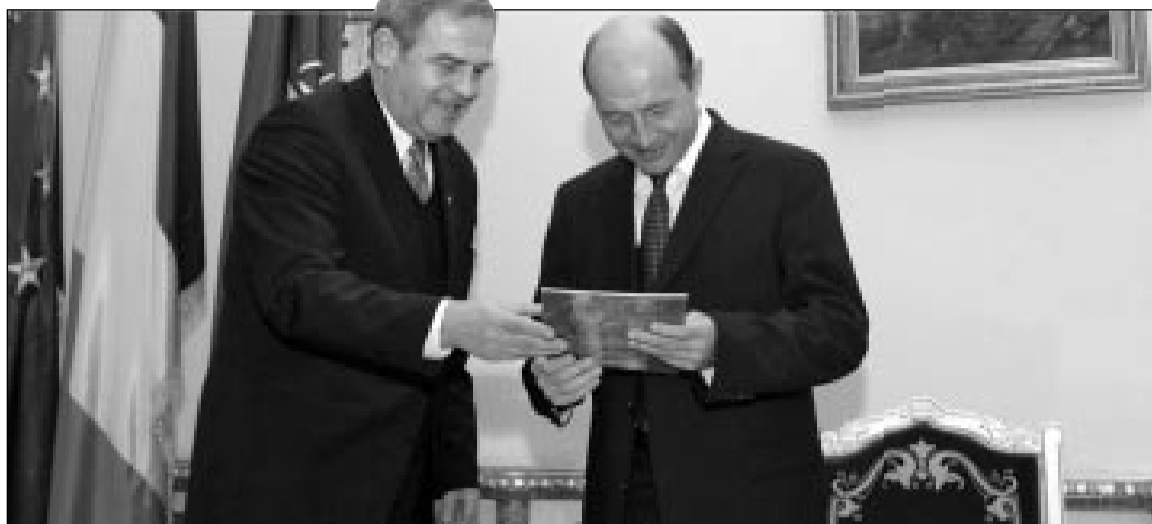
2007. december 5-én egyeztetett legutóbb Tőkés László és Traian Basescu, képünk akkori