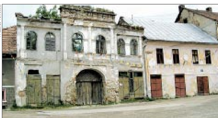
Csak a homlokzat maradt: Verespatakat főtere ma már csupán díszlet