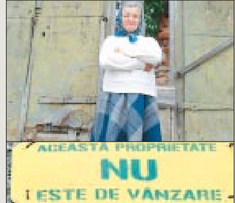
Amazon néni. Szinte teljesen „be vannak táblázva” a verespatakiak. A legtöbb házon (még a műemlékeken is, amelyeket szintén el lehetett adni és meg lehetett venni) elhelyezett feliratok segítségével az RMGC figyelmeztet, hogy ez is az ő tulajdonuk már. Vannak viszont olyan helybéliék – mint e néni a képen –, akik küzdenek, és gyerekeiket is erre nevelték. Az ő házukon azt hirdeti az „ellentábla”, hogy a lakás nem eladó.