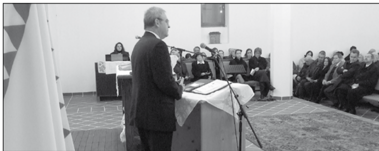
Tőkés László az úgynevezett Reménység Szigetén

Előadásában először a reformáció történetét elevenítette fel, majd áttért az 1989-es ateista és kommunista diktatúrák bukására, a katolikus egyház ebben vállalt szerepére Lengyelországban és Németországban, de ide sorolta a temesvári reformátusok helytállását is. Tőkés László elmondta még, hogy a reformáció korához hasonlóan a magyaroknak is vissza kell térniük az őskeresztyén gyökerekhez, „ahonnan újra sarjadhat a mi keresztyénségünk, hitünk, kultúránk, és meg tudunk újulni, követve a nyugat-európai keresztyén modellt, de felmutatva a már a tordai vallásbéke megkötésekor tanúsított toleranciánkat, amit azonban már nem a Nyugattól kell átvennünk”.