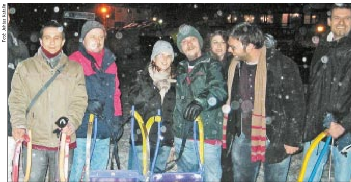
Célban, hóhullásban: a Dolomiti Superski pályáin mi is kipróbáltuk az éjszakai száánkózszt

Az átlagos vendég háromszilagosnál rosszabb szálláshelyet nem is választ, pedig van. Vanzi szerint még évekre tarthat, amíg Kelet-Európa turizmusa is felzárkózik és igazán megenyhedheti majd magának a Nyugaton már mindenkinek elérhető Dolomiti Superskit.