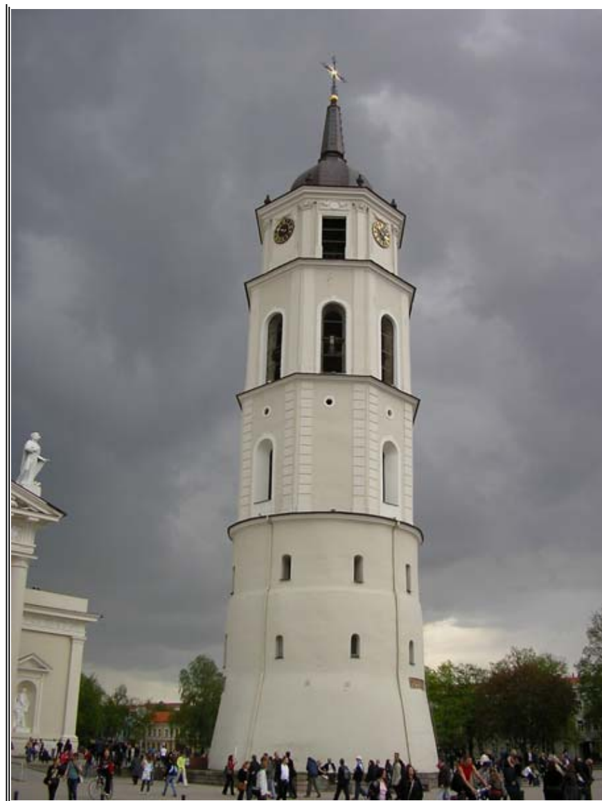
A katedrális harangtornya

Hozzá kell azonban tenni, hogy a kérdés tényleg nehéz, hiszen a Litván Köztársaságban meglehetősen kevés nagyváros van. Már csak azért is, mert az EU-hoz 2004-ben csatlakozott ország népessége nem éri el a 3,5 millió főt. S ha már a lakosságról beszélünk, tudni kell, hogy nemzetiségi szempontból Litvánia igen sokszínű, hiszen számos kisebbség él területén: elsősorban lengyelek (a lakosság 6 százaléka), oroszok (5%), fehéroroszkok (1,1%), tatárok, németek, ukránok, romák és más nemzetiségűek – a litvánok így „csak” mintegy 84%-os többségben vannak. Vallásilag is igen változatos az ország lakossága, bár ez esetben a többség fölénye még nagyobb: a lakosok 90%-a római katolikus, majd következnek a sorban az ortodoxok (nagyjából 5%), evangélikusok (3%), de akár muzulmánokkal is találkozhatunk az utcákon.