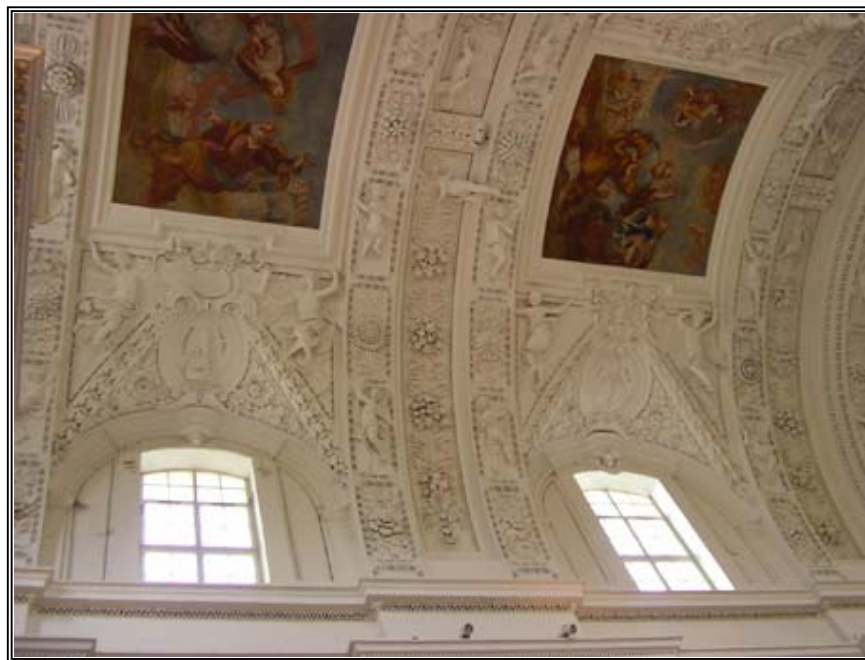
Szent Péter és Pál templomának stukkódíszítése lenyűgöző, kétezer figurát számolhat össze az, aki nem csak pusztán csodálni akarja