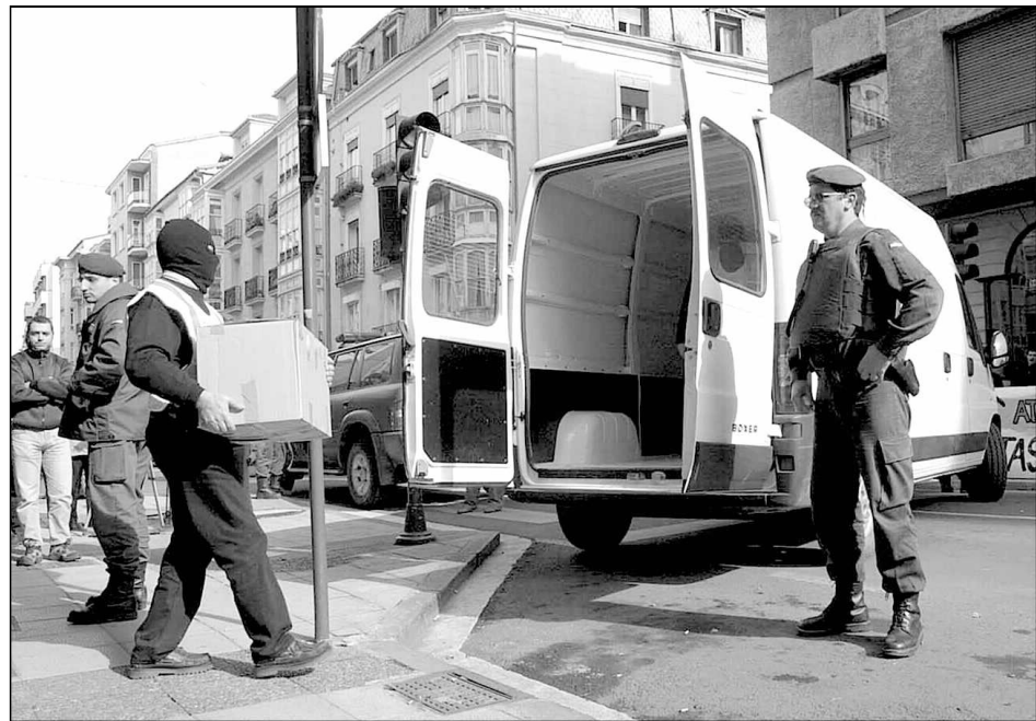
La Guàrdia Civil va escorcollar les seus i hi intervingué informació empresarial durant la matinada d'ahir en una operació amb 300 números.