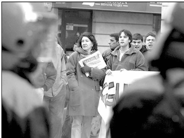
El tancament originà protestes de treballadors i de lectors, que continuaran avui.

dictat pel jutge, l'operació s'emmarca en la investigació d'un presumpte delictes de pertinença o col·laboració amb l'organització ETA militar, respecte a la presumpta instrumentalització de les societats mercantils Egunkaria Sortzen S.L. , Egunkaria S.A. i del diari Euskaldunon Egunkaria .