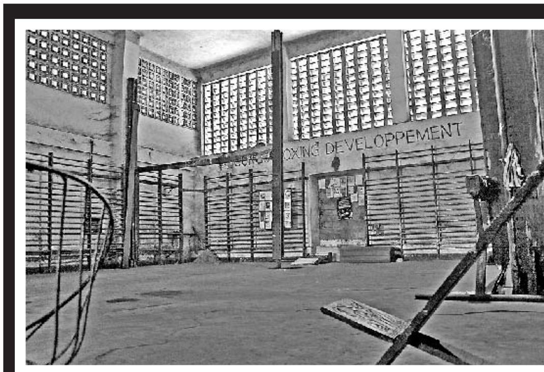
LUGARES IRREPETIBLES Sala na que adestrou Ali antes do combate

e decide cambiar o nome do país. O Congo convértese no Zaire. Mobutu preguntase como dar a coñecer este "novo" país. Ali convértese nun instrumento de comercialización. Estes dous homes totalmente opostos encóntranse sobre un punto: volverlle dar a súa dignidade ó home negro e así converterse en iconas mesmo do terceiro mundo. O combate permitirá promover Zaire (o ex Congo belga) en todo o mundo. O cartel do combate anuncia a cor: "Un encontro entre dous Negros, nun país negro, organizada por Negros e esperado polo mundo enteiro: ¡É aquí unha vitoria do mobutismo!". Para facer vir os dous campións ó centro de África, o home do pucho de leopardo non vai reparar en gastos. As televisións americanas esixen que o partido se retransmita en directo. Isto farase, a pesar dos gastos exorbitantes que iso implica. Para poder desprazar a todos os xornalistas, Mobutu readquire o conxunto de autobuses do mundial de fútbol de 1974 en Alemaña. "De feito, para o país é o principio da bancarrota" insiste a Kabala. O diñeiro non conta. O pobo paga. Só a