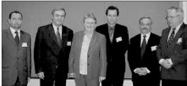
A delegáció brüsszeli tárgyalásai egyik színhelyén

A küldöttség közben hazatért, és ma már Nagyváradon tart sajtótájékoztatót a részletekről.