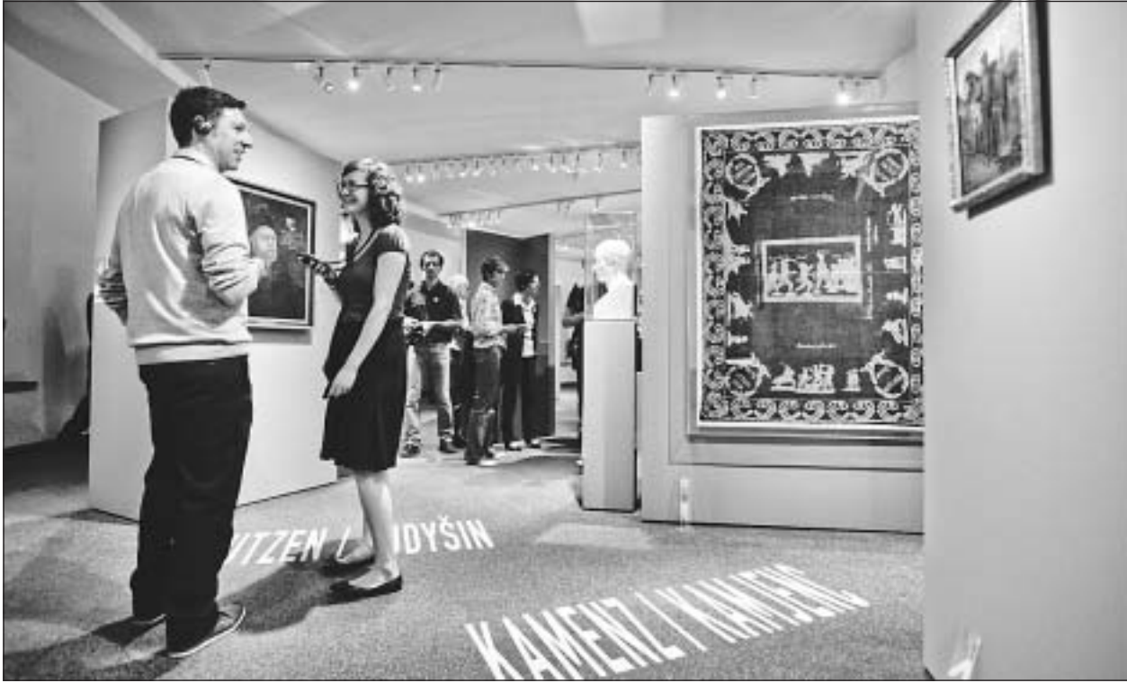
Der sächsische Ministerpräsident Stanislaw Tillich (CDU) hat am 21. Mai die 3. sächsische Landesausstellung „Via Regia – 800 Jahre Bewegung und Begegnung“ im Görlitzer Kaisertrutz eröffnet. Sie befasst sich mit der Geschichte der alten Handelsstraße Via Regia, die auch durch sorbisches Siedlungsgebiet um Kamenz und Bautzen verlief. Unter anderem werden auch einige sorbische Exponate gezeigt. Im Görlitzer Kulturhistorischem Museum haben Besucher die Möglichkeit sich via Audioguide einige ausgewählte Sprichwörter auf Sorbisch anzuhören. Die Ausstellung ist bis Ende Oktober geöffnet.