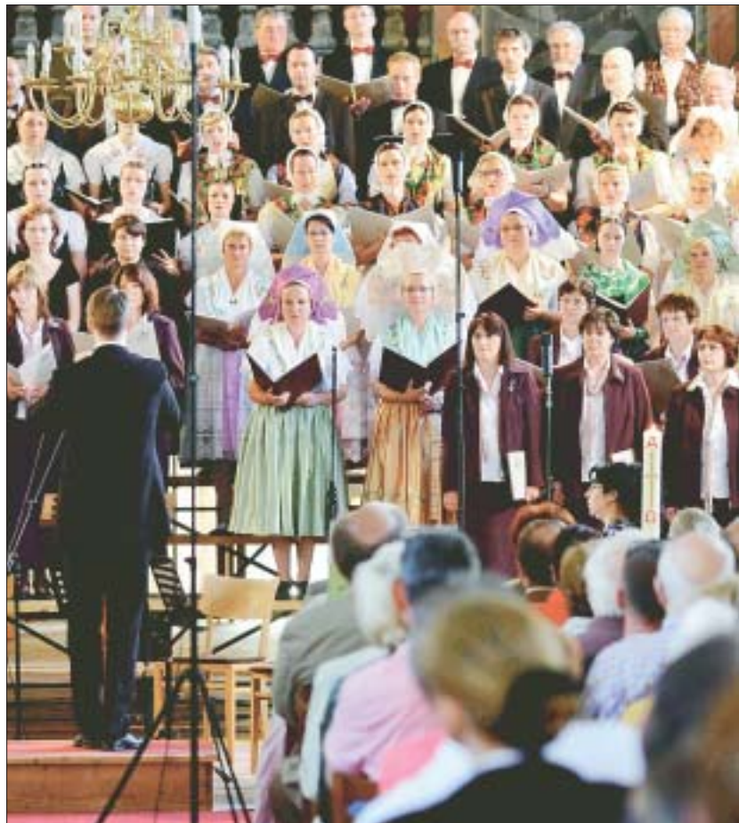
Ein Musikereignis besonderer Art erlebten die Anwesenden des Festaktes zum 20-jährigen Bestehen des Domowina-Regionalverbandes Niederlausitz am 22. Mai in der Cottbuser Oberkirche. Acht sorbische Chöre zeigten mehr als 40 Darbietungen und zum Schluss auch ein großes gemeinsames Finale.

Man könnte nun sagen, wir haben es geschafft, und sich zurücklehnen. Nein! Wir haben zwar viel geschafft, doch noch nicht alles. Nutzen wir deshalb alle Möglichkeiten, um die sorbische Sprache lebendig zu halten und weiterzuentwickeln.