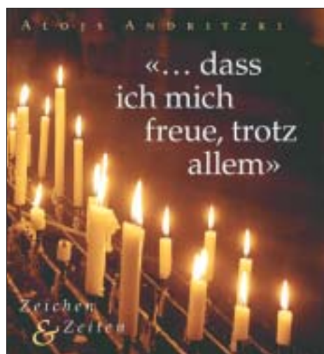
Der Lusatia Verlag bietet Andritzki komprimiert für Liebhaber und Einsteiger an.

Das Büchlein trägt den unaufrichtigen Titel „... dass ich mich freue, trotz allem“ und verwehrt auf nicht einmal 70 Seiten Äußerungen, Textauszüge und Briefausschnitte Andritzkis mit Naturaufnahmen, Bildern aus der ka-