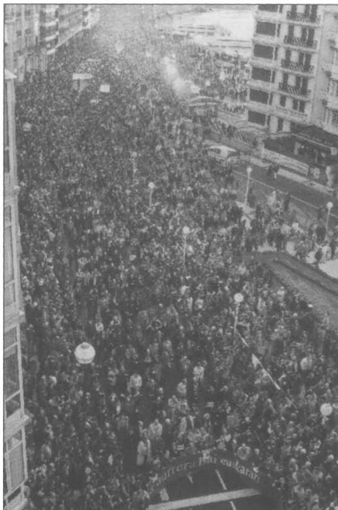
Ein großer Teil der Bevölkerung des Baskenlandes steht hinter der von den Spaniern geschlossenen Tageszeitung „Euskaldunon Egunkaria“. Die Demonstration in Donostia-San Sebastian am Samstag (Bild) war die größte, an die man sich dort erinnern kann, informierten uns gestern Mitarbeiter der Zeitung.