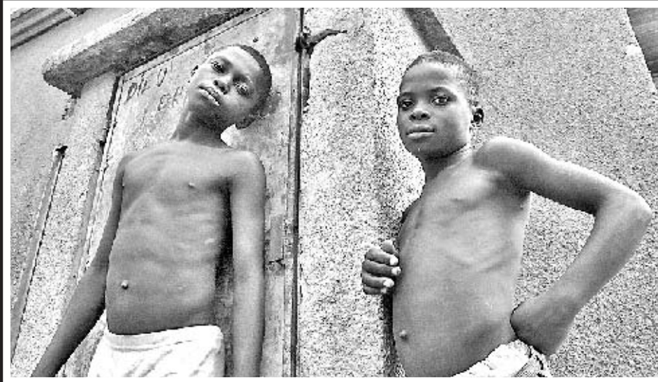
DOUS DOS CATIVOS ABANDONADOS POLAS SÚAS FAMILIAS, QUE OS CONSIDERAN BRUXOS