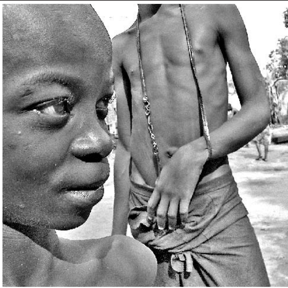
DOUS NENOS BRUXOS NAS RÚAS DE KINSHASA