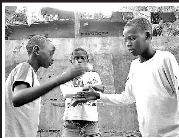
OS PÍCAROSS SOBREVIVEN XUNTOS NA RÚA