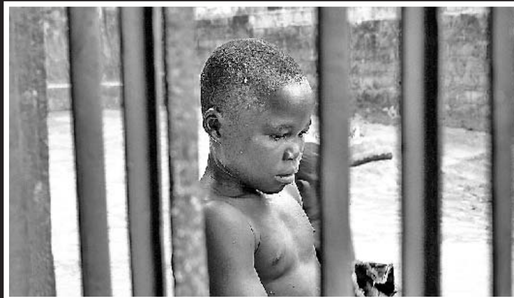
CATIVO Ó QUE TODOS LLE CHAMAN KABILA POLO SEU PARECIDO CO PRESIDENTE CONGOLÉS