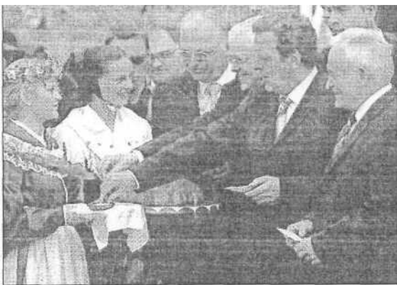
Auch Bundeskanzler Gerhard Schröder durfte zur EU Osterweiterung die sorbische Gastfreundschaft und den sorbischen Gruß, mit Brot und Sah kennen lernen.