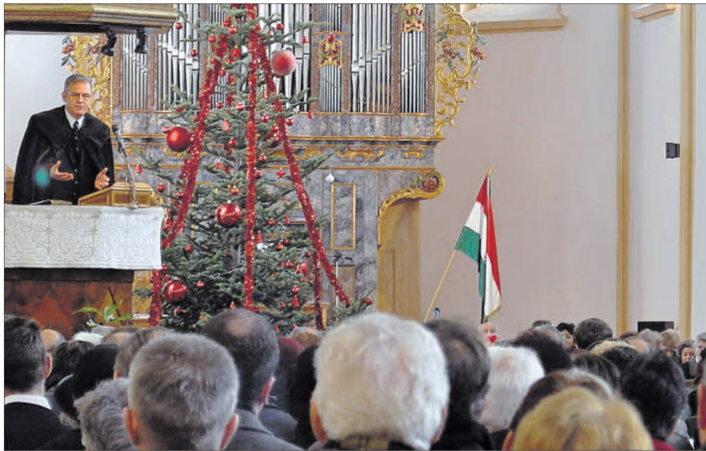
Nationale Symbolik 1: Bischof Laszlo Tökes predigt in der reformierten Kirche. Im Chorraum ist die ungarische Fahne zu erkennen.

Vergeblich sucht man jedoch auf dem Hauptplatz einen Erinnerungsstein für jene, die während der Revolution im Dezember 1989 starben, oder für jene acht Menschen, die im März 1990 auf dem Hauptplatz bei Unruhen den Tod fanden, die vom immer noch mächtigen