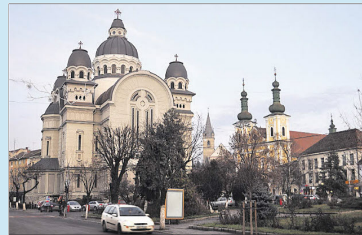
Von links die orthodoxe Kathedrale, die reformierte Burgkirche und die katholische Kirche.

Schon bald, nachdem Rumänien nach 1918 Siebenbürgen in Besitz genommen hatte, wurden bleibende Zeichen gesetzt. Auf das obere Ende des weitläufigen Neumarkter Hauptplatzes wurde eine protzige orthodoxe Kirche gebaut: Das Foto rechts zeigt das heutige Aussehen mit der orthodoxen Kathedrale im Vordergrund, der katholischen Kirche rechts und in der Mitte im Hintergrund die reformierte Kirchenburg. Links eine Ansicht aus dem 19. Jahrhundert.