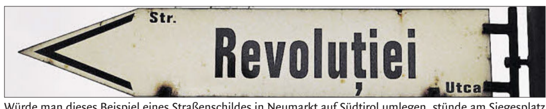
Würde man dieses Beispiel eines Straßenschildes in Neumarkt auf Südtirol umlegen, stünde am Siegesplatz nur „Piazza della Vittoria Platz“.