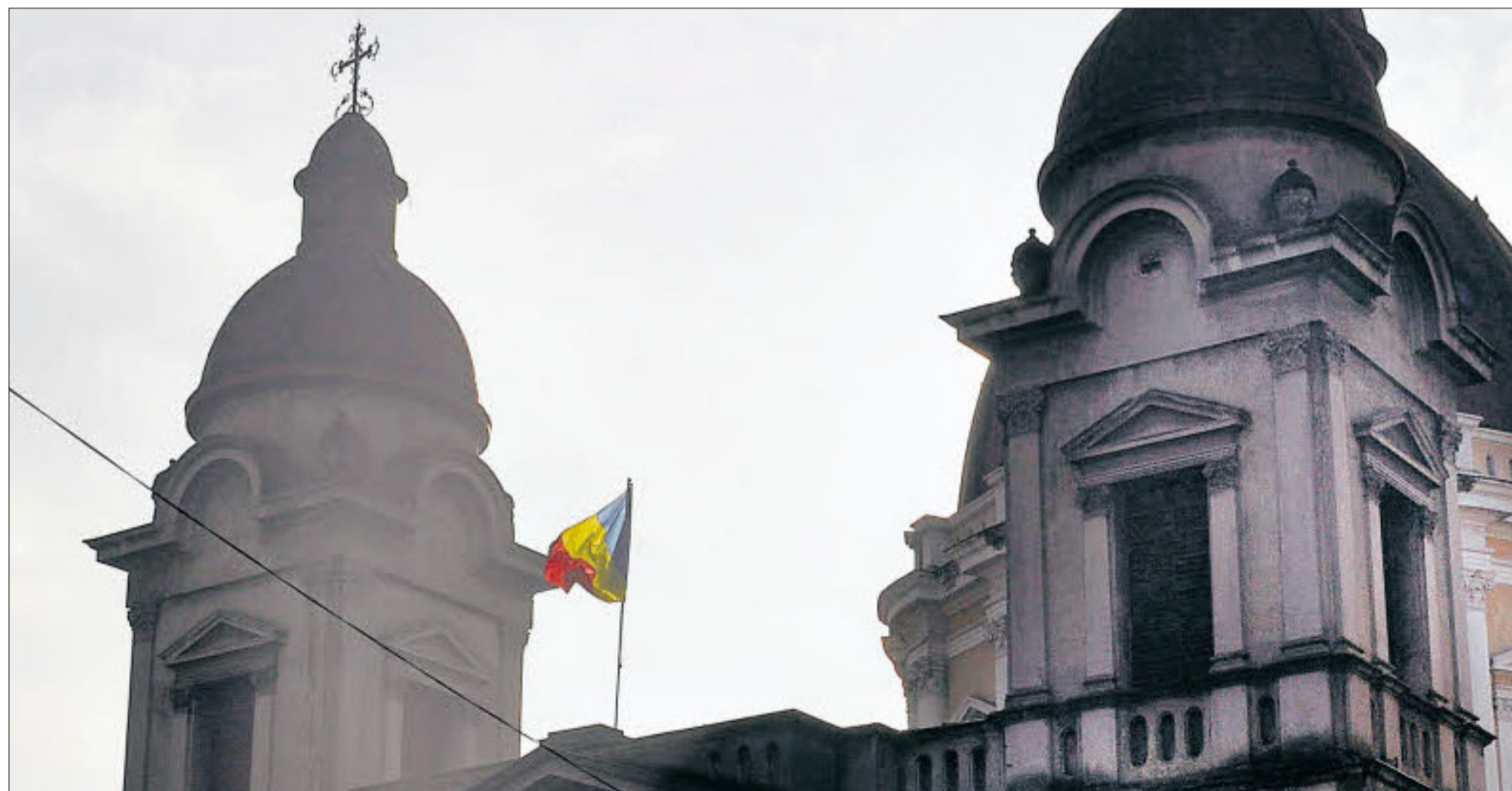
Nationale Symbolik 2: An der zweiten orthodoxen Kirche am Hauptplatz weht weithin sichtbar die rumänische Flagge.

Die ungarische Minderheit in Rumänien ist in zwei Teile gespalten. Der Dachverband der Ungarn in Rumänien (RMDSZ) ist die größere der beiden ungarischen politischen Bewegungen; er zieht rund zwei Drittel der ungarischen Wählerstimmen auf sich. Dagegen weiß der Ungarische Nationalrat für Siebenbürgen, die Bewegung des reformierten westsiebenbürgischen Bischofs Laszlo Tökes, das restliche Drittel der Ungarn hinter sich. Die beiden Bewegungen, über Jahre hinweg schwer zerstritten, tun sich schwer mit der im Vorjahr vereinbarten Zusammenarbeit. Zwar wurden 2009 die Europawahl (Tökes sitzt erneut im EU-Parlament) und die Parlamentswahl im November gemeinsam bestritten, doch Tökes lehnt die Beteiligung des RMDSZ an der neuen rumänischen Regierung vehement ab. Im Bild Laszlo Tökes mit „Dolomiten“-Redakteur Hatto Schmidt bei der Überreichung des Bathory-Preises an die „Dolomiten“ Mitte Jänner in Neumarkt.