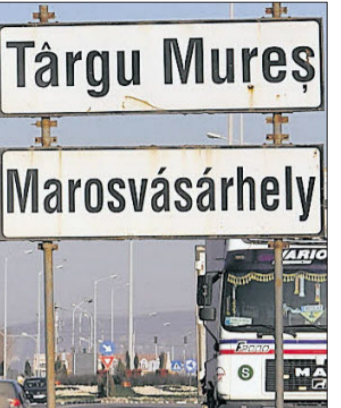
Immerhin: Die Ortsschilder – und auch die Homepage der Stadt sind zweisprachig.