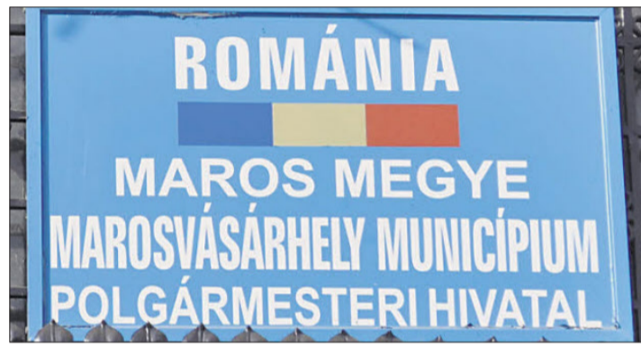
Polgármester? Richtig: das bedeutet Bürgermeister auf Ungarisch.

Dort wird stolz der lateinische Name Municipium Aelium Hadrianum Napoca einer 124 n. Chr. gegründeten römischen Siedlung angeführt – und solchermaßen suggeriert, dieser Ort sei seit dakischer Zeit von den Vorfahren der Rumänen besiedelt gewesen. Diese in der rumänischen Geschichtsschreibung zum unumstößlichen Dogma erhobene Interpretation ist nicht nur mehr als kühn, sondern in dieser Form nicht haltbar. Sie eignet sich aber prächtig, um Ansprüche der nach 1918 zur Minderheit gewordenen Ungarn zurückzuweisen.