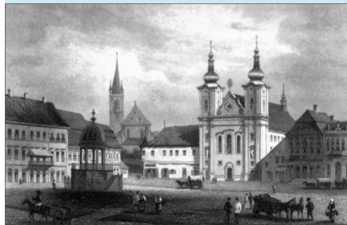
Eine Ansicht aus dem 19. Jahrhundert: Im Hintergrund die reformierte Burgkirche, vorne rechts die katholische Kirche.

Skurril wirkt die Tatsache, dass der rumänische Diktator Nicolae Ceausescu 1974 die Erweiterung des Namens Cluj zu Cluj-Napoca befahl – was heute noch auf der offiziellen Homepage der Stadt zu bemerken ist ( http://www.clujnapoca.ro/ ).