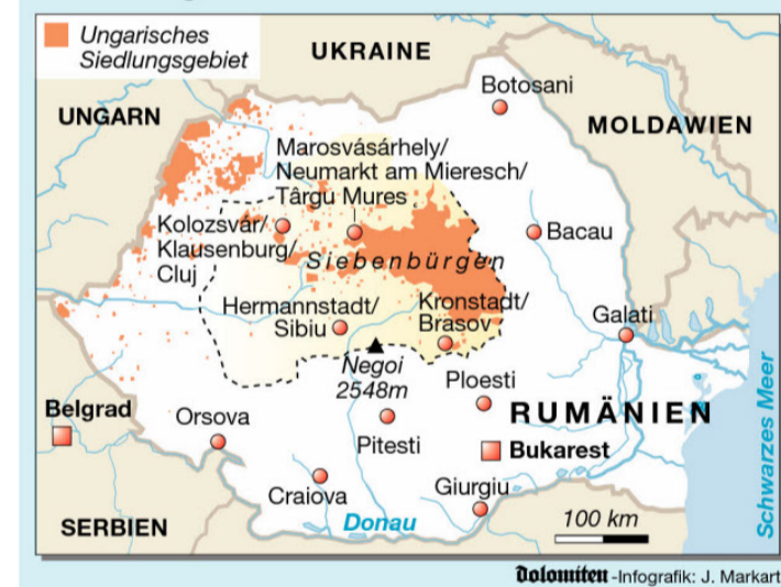
Dolomiten - Infografik: J. Markart