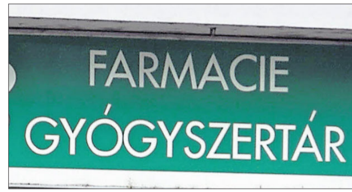
In Neumarkt sind einige Geschäfte zweisprachig beschriftet, aber bei-leibe nicht alle Inhaber sehen mehrsprachige Schilder als sinnvoll an.

Eine große Chance sollte den Ungarn die schon lange von der EU geforderte Dezentralisierung des Staates bieten: Denn egal wie man das Kind nennen will – sobald Befugnisse auf die regionalen und lokalen Behörden übergehen, werden die Ungarn sehr viel mehr zu sagen haben bei der Regelung ihrer Angelegenheiten. Dem Modernisierungsdruck aber wird Rumänien nicht auf lange Sicht widerstehen können.