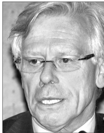
Knut Vollebaek sch

„D“: Die extreme Rechte erstarkt in nicht wenigen Staaten Europas, man denke an die Wahren Finnen, die Jobbik in Ungarn, die Front National in Frankreich. Laufen die nationalen Minderheiten in Europa Gefahr, zwischen die Ablehnung der