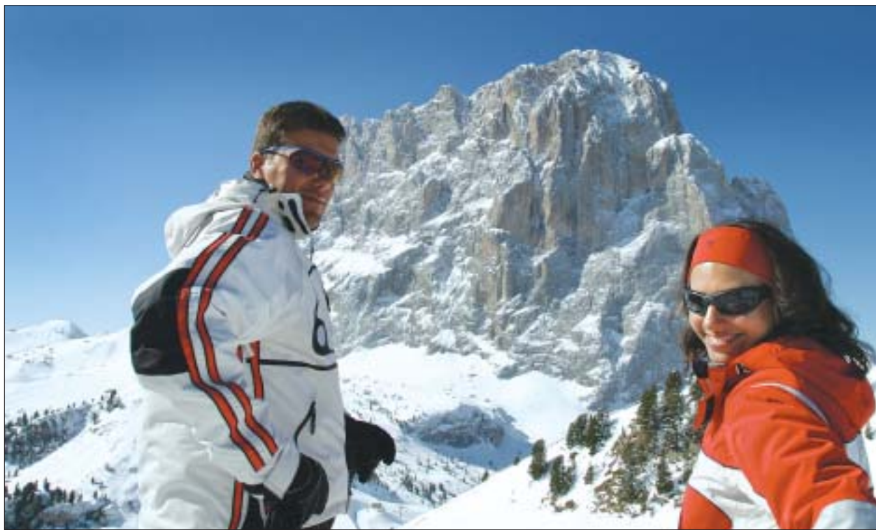
W Dolomitach móžeš wuběrnje sněhakowac

K Dolomiti Superski słuša 138 towaršnosćow - často su to swójbnje zawody, kotrež wobsedza lifty a powjaznicy a su zdobom za loipy a sněhakowanske skloniny zamołwite. Zymskosportowe přestrjenje, tak Vanzi, su dale wobsydstwo priwatnikow, na přiłkad ratarjow, abo komunow. W sněhakowanskej sezonje su wone wotnajene. Jenož tute towaršnosće maja personal přibližnje 3 000 wosobow. Cyłkownje ma 30 000 luźi w turistiskej infrastruktury džěło, 95